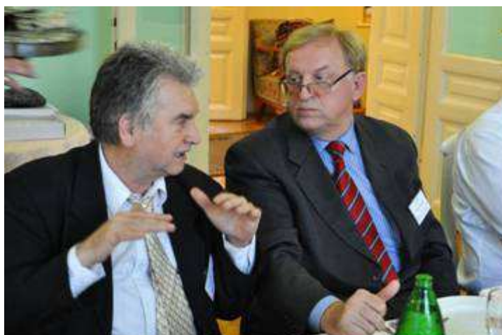
Milan - XIV conference „Science in Practice”; coffee break and discussion. (Politehnika, Subotica, svibnja 2010.)