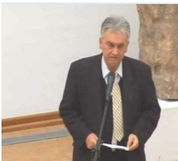
Milan - Dodjela Mirovne nagrade „Krunoslav Sukić“ (Arheološki muzej, Osijek; prosinac 2012.)