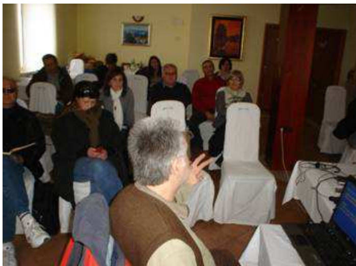
Milan - Seminar za novinare „Procesi tranzicije u Republici Hrvatskoj“ (Gospić, Hotel „Ana“; ožujak 2012.)