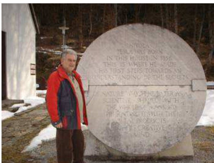
Milan - U Muzeju Nikole Tesle (Gospić, ožujak 2012.)