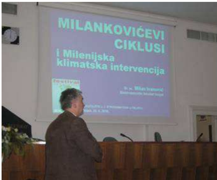
Milan - Festival znanosti ' 2010. (Rektorat Sveučilišta u Osijeku; travanj 2010.)