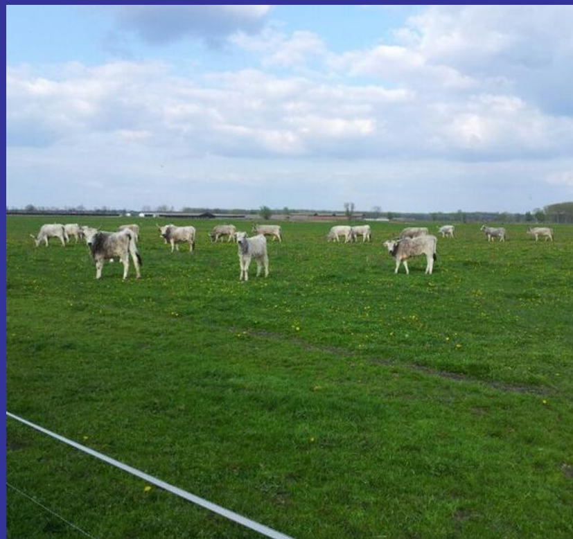
Slika 16.-17. Pašnjaci Farme Eblin [22]