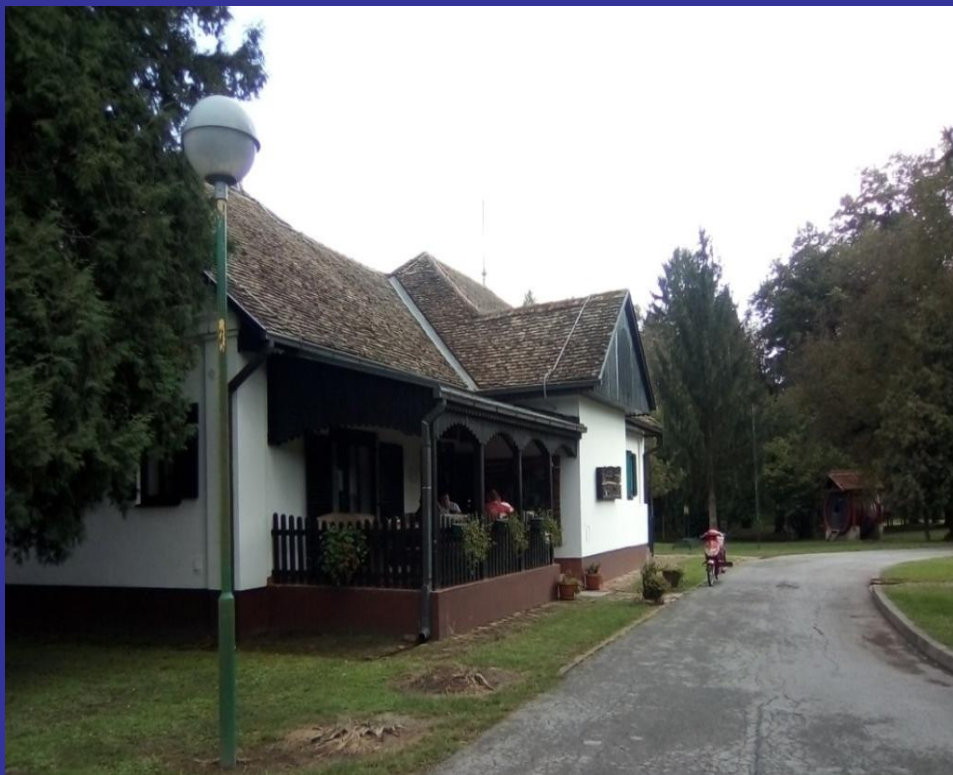
Slika 18. Restoran "Kormoran" [23]

Na mjestu upravne zgrade pustare Podunavlja otvoren je restoran "Kormoran".