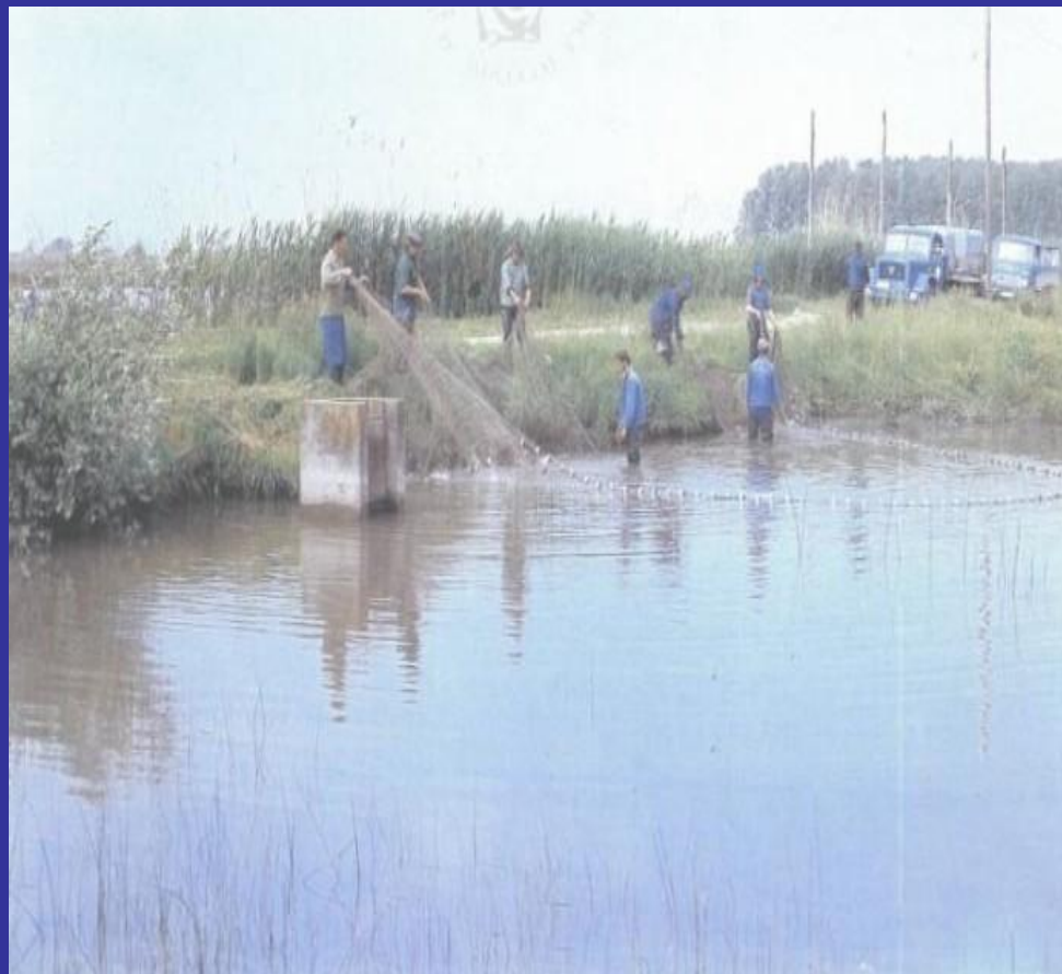
Slika 5. Izlov ribe (1972.) [11]