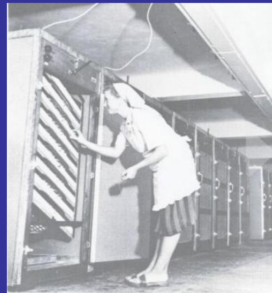
Slika 12. Inkubator (Kokin grad, 1951.) [9]