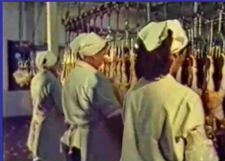
Slika 13. Obrada peradi, 1984. Mesna industrijs Mece [12]