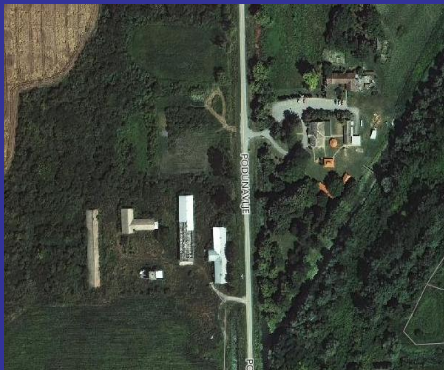
Slika 19. "Kormoran" desno) i nekadašnji peradarnici (lijevo) [24]

Više hala peradarske farme uz cestu (nasuprot „Kormorana“) nisu u funkciji od 1998. g. -zapuštene su i propadaju.