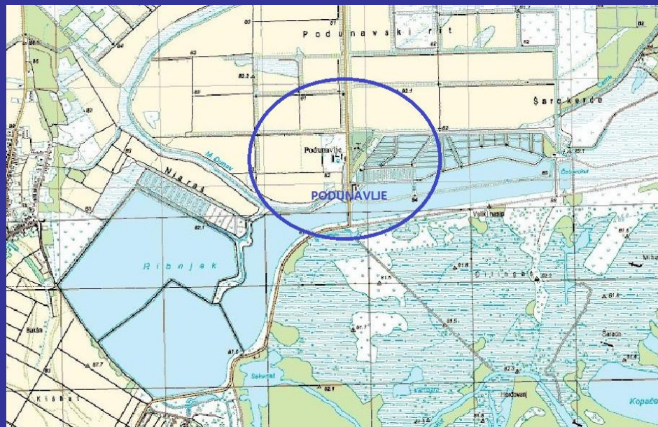
Slika 1. - 2. Lokacija pustare Podunavlje [3]