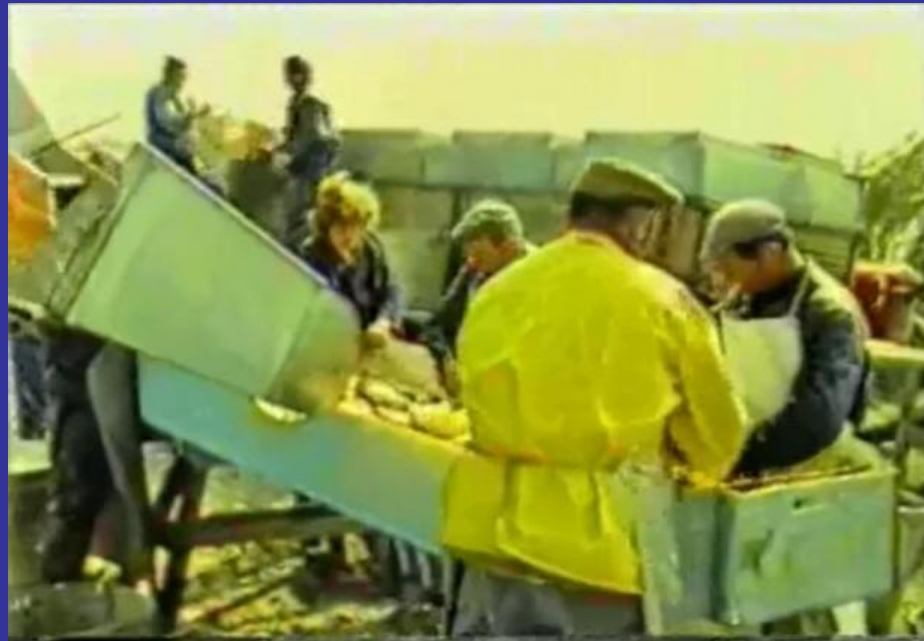
Slika 6. - 7. Izlov ribe (1984.) [12]