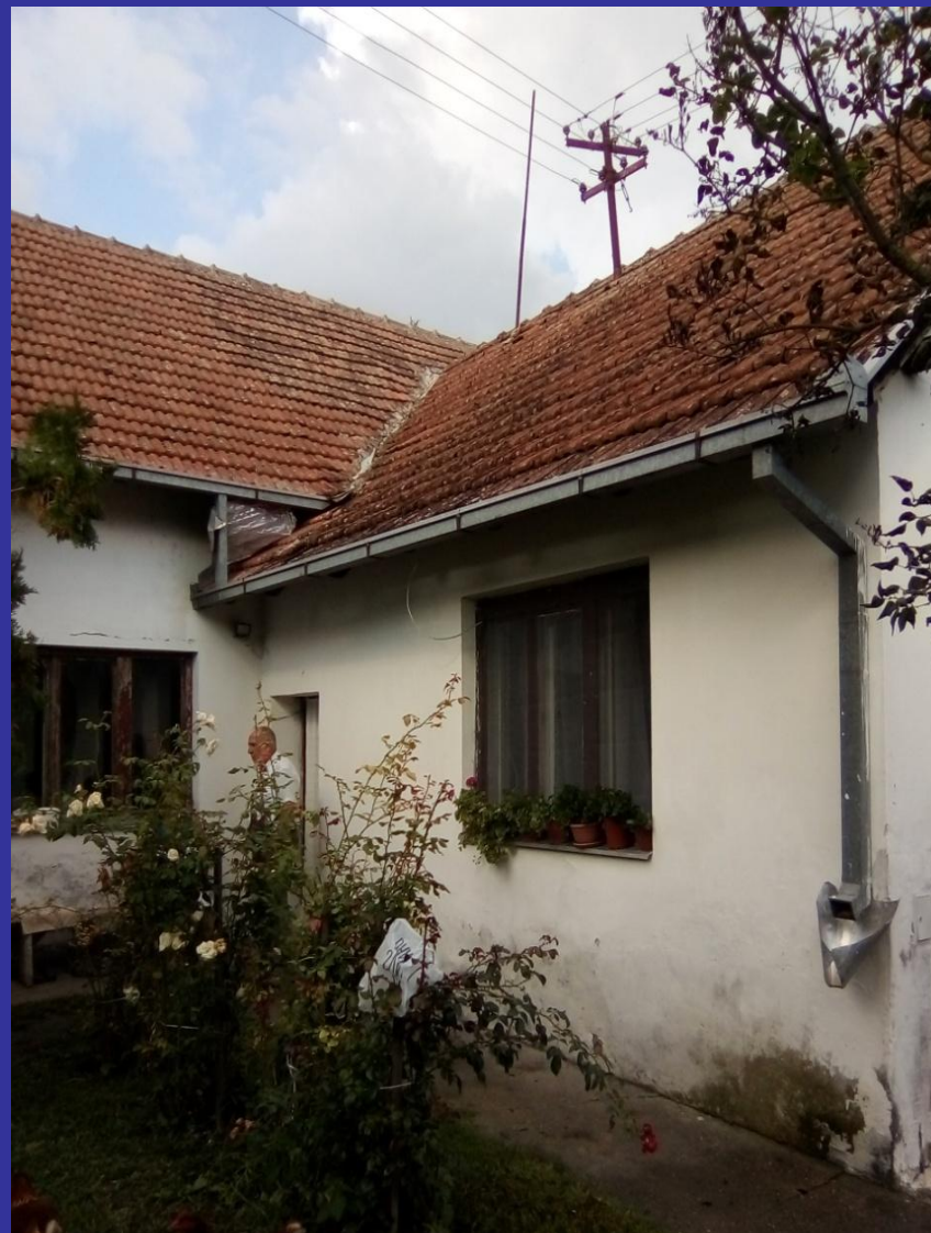
Slika 20.-22. Jedina stambena (naseljena) zgrada u Podunavlju [23]