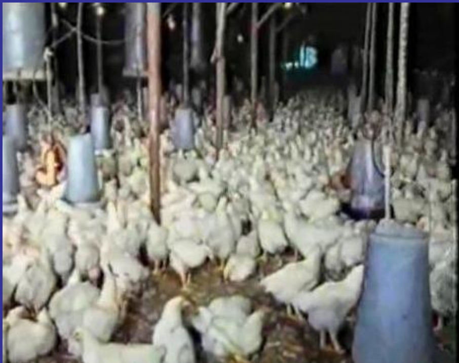
Slika 11. Peradarnik, 1980-tih [17]

U isto vrijeme na ovoj pustari postojala je i farma pilića i koka nesilica (pogon „Živinarstvo“ PIK-a „Belje“) na kojoj je bilo zaposleno 150 radnika; Nažalost i ova je proizvodnja ugašena krajem 90-tih. [16]