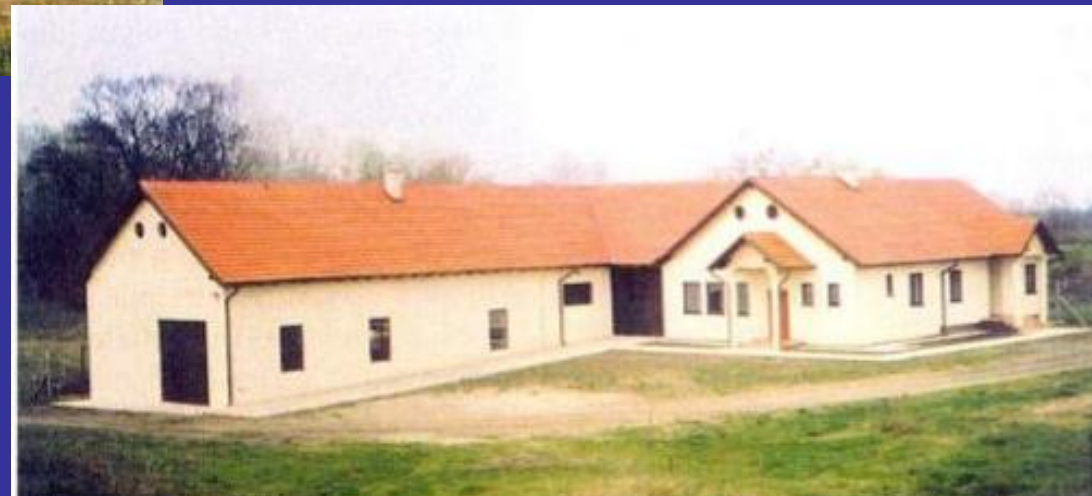
Slika 15. Crpna stanica Podunavlje (nakon obnove, 2002.) [20]

Crpna stanica Podunavlje (1980.-tih) [20]