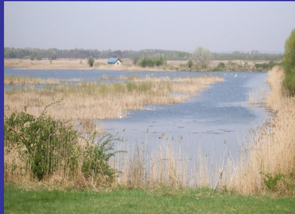
Slika 3. Ribnjaci [10]