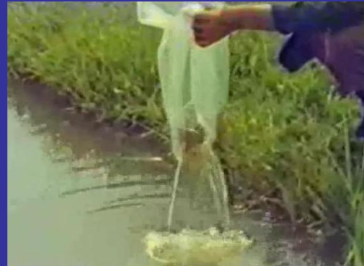
Slika 9. Puštanje riblje mladi u ribnjak [12]