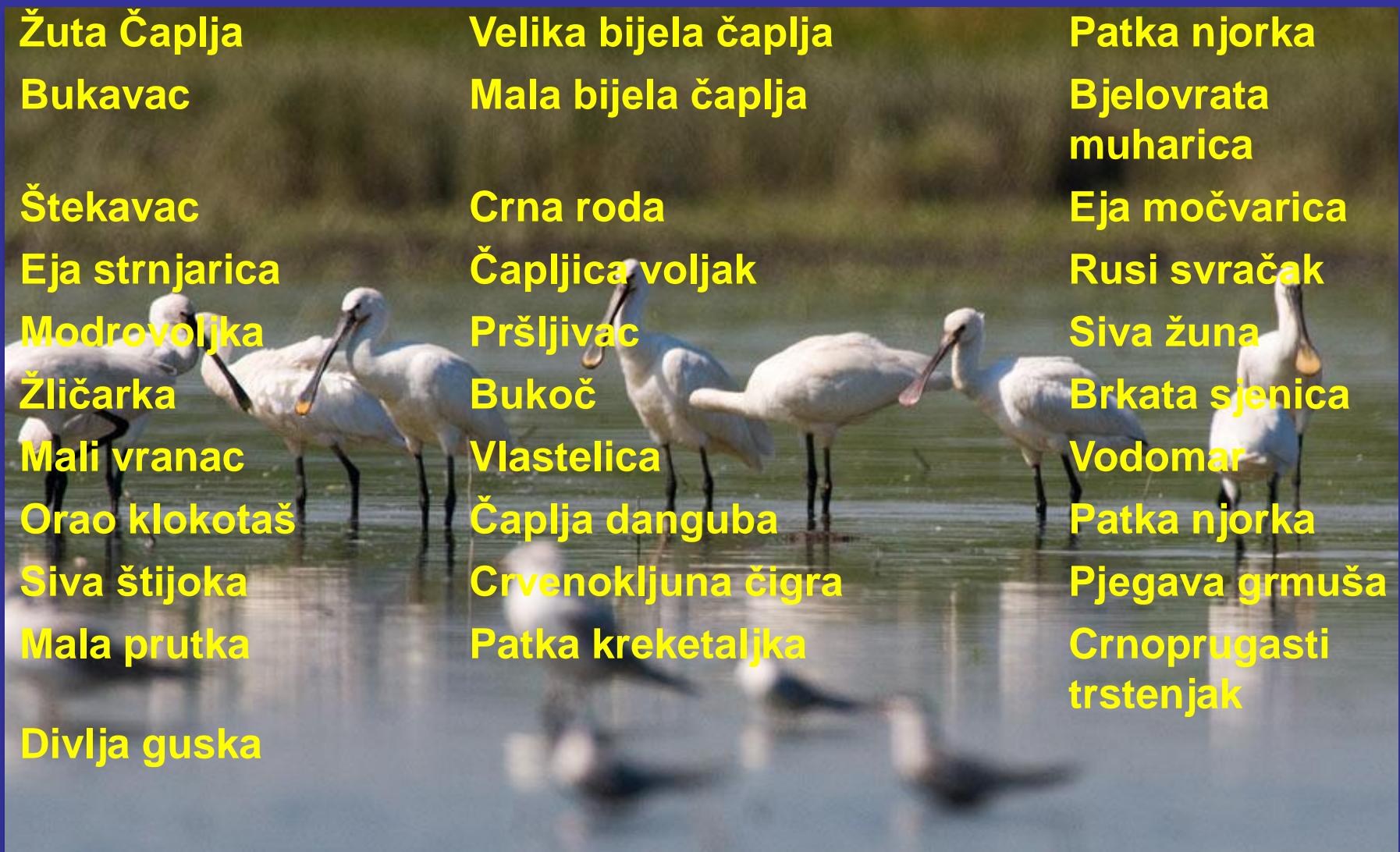
Slika 10. Bijela čaplje [15]