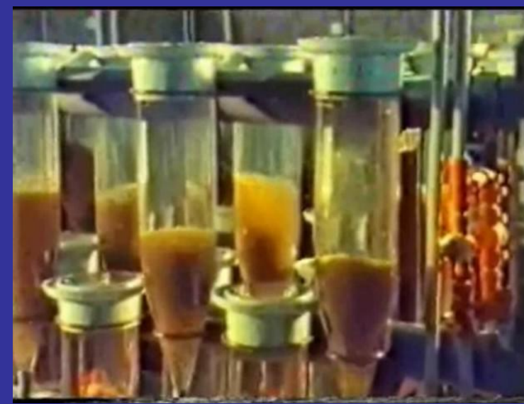
Slika 8 Laboratorijska priprema mrijesta, 1980-tih [12]