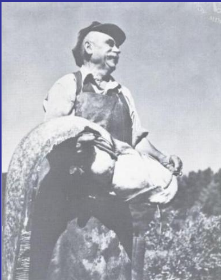
Slika 4. Trofej s ribnjaka (1952.) [11]